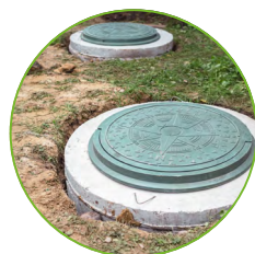
Estruturas elevadas ou enterradas